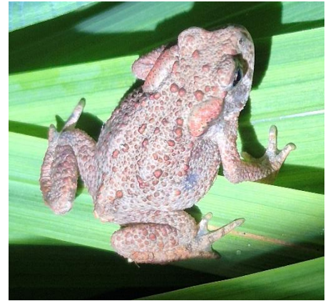
Abb. Erdkröte, weiblich, am Moossee

In erster Priorität sollen Arten gefördert werden, die es besonders nötig haben, weil sie gefährdet sind, und von denen in Moosseedorf noch eine Population existiert. Die Förderung zielt auf den Erhalt und die Aufwertung ihrer Lebensräume und Vermehrungsorte.