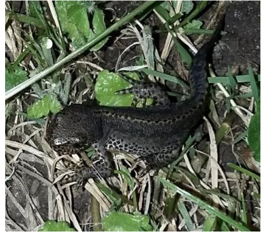
Abb. Bergmolch im Sommerkleid bei der Jagd an Land

Zweitens sollen einige für die Bevölkerung attraktive Arten gefördert werden, welche als Aufhänger für ein Thema oder als Schirmart für andere Arten dienen: